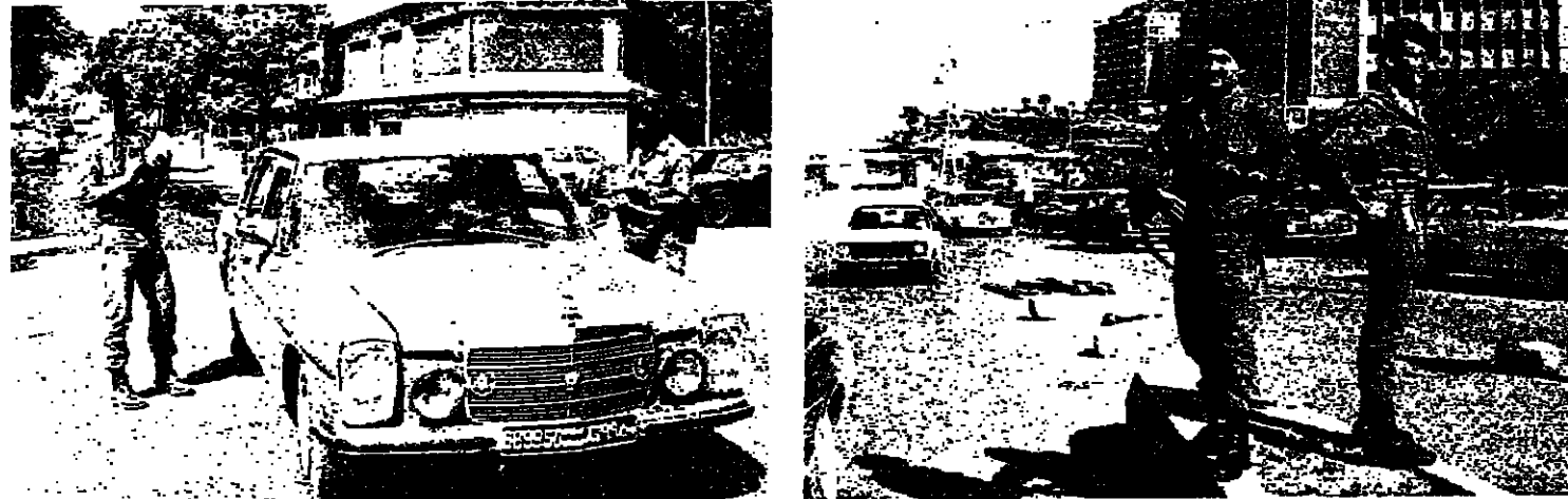
عناصر من قوى الامن في شوارع بيروت